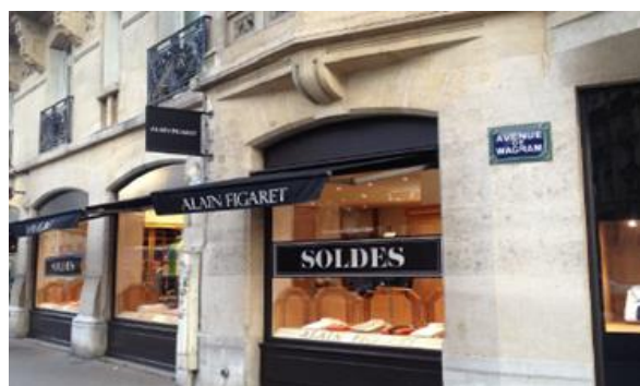
134 rue de Courcelles – PARIS (17 ème )