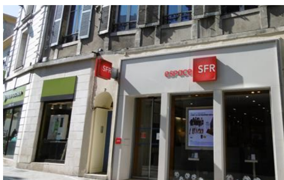
7 rue du Commerce – BOURGES (18)

Conformément à la 6 e résolution de l'Assemblée Générale du 21 mai 2014, le montant total des dettes financières pouvant être contracté par votre SCPI est plafonné à 40 M€.